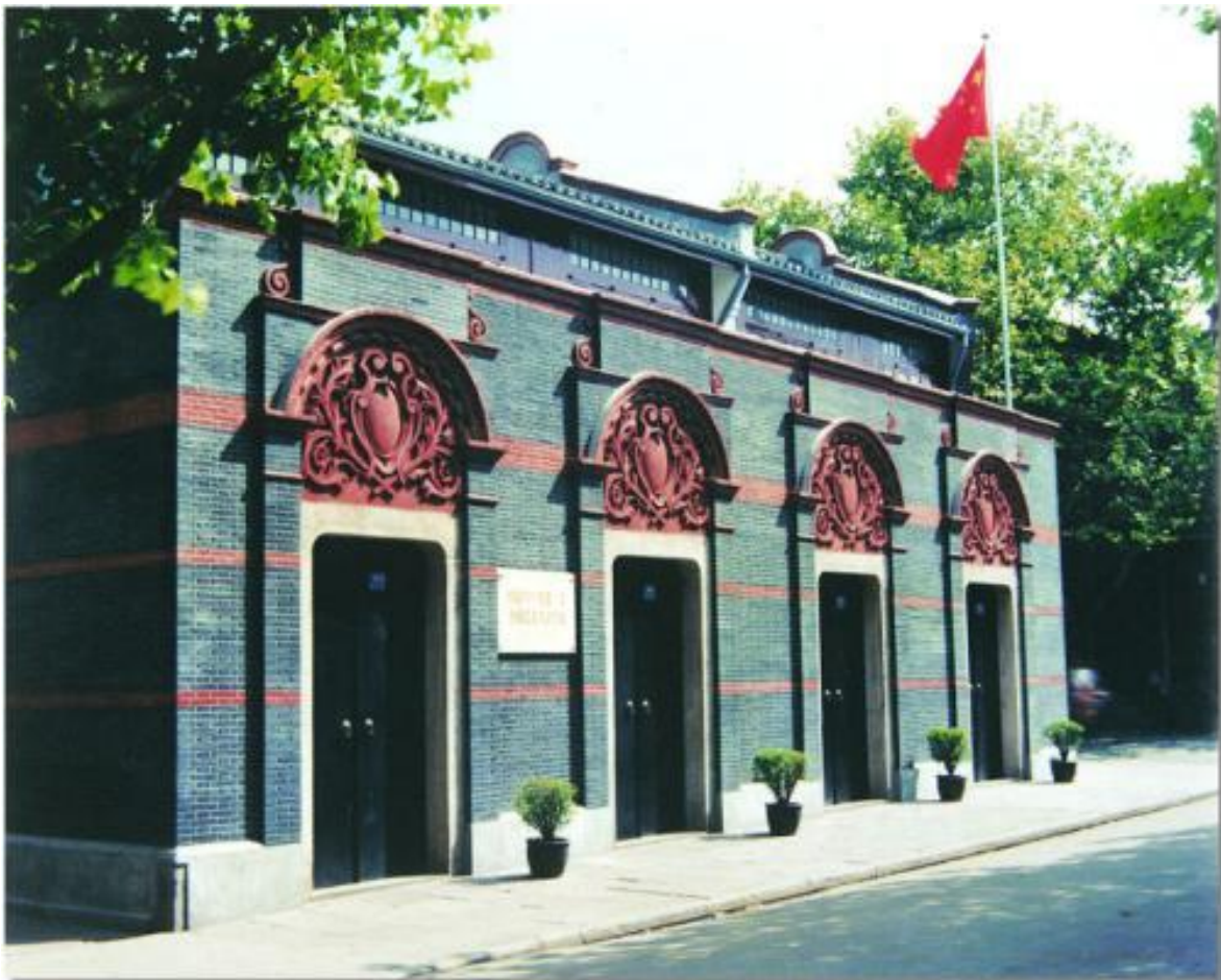
中共“一大”会址 (上海望志路106号)