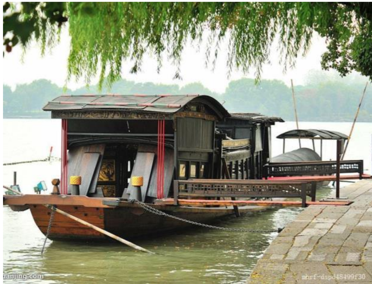
浙江嘉兴南湖游船